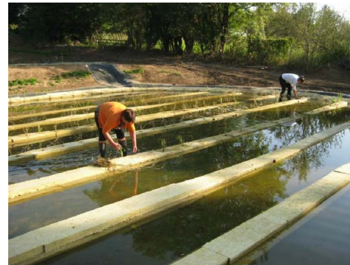
VÝSADBA ROSTLIN V ČISTIČÍCH LAGUNÁCH